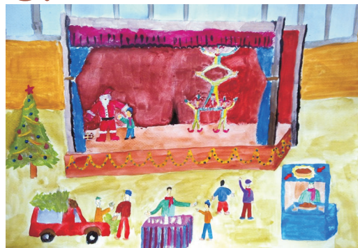
Томислав Дамянов Vб клас